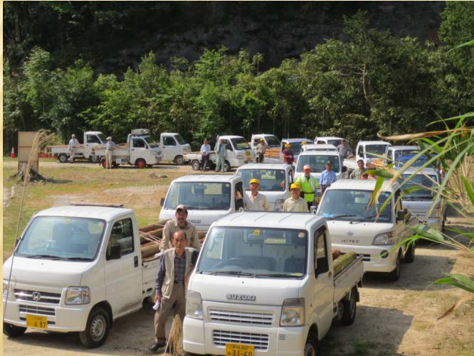
愛知県岡崎市額田地域